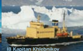
IB Kapitan Khlebnikov