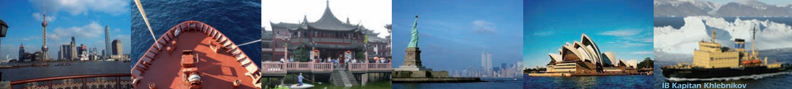
IB Kapitan Khlebnikov